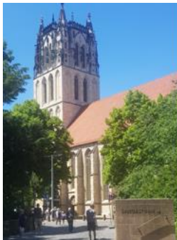
„Der St. Paulus-Dom“

Die Kathedrale des Bistums Münster zählt zu den bedeutendsten Kirchenbauten in Münster und ist neben dem historischen Rathaus, eines der Wahrzeichen der Stadt.