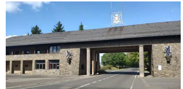
Auf dem Bild „die Einfahrt zur Ordensburg“

1933 forderte Adolf Hitler in einer Rede an der Reichsführerschule der NSDAP und der Deutschen Arbeitsfront in Bernau bei Berlin den Bau von neuen Schulen für den Führernachwuchs der NSDAP.